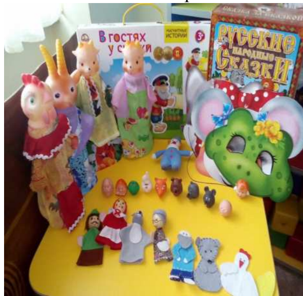
Рис.2 Театр теней